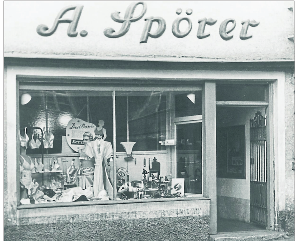
Zeitreise: 60 Jahre liegen zwischen diesen beiden Bildern.