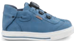
ARTEMIS OS-TN5 | TN8 | 24-42