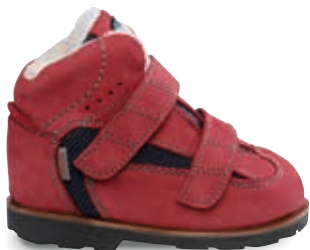
BERNI OS-TN8 | 26-38