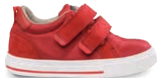
CORA OS-TN5 | TN8 | 21-35