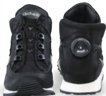
APOLLO OS-TN5 | TN8 | 24-47