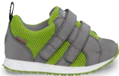
TIM OS - TN5 | TN8 | 20-35