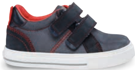
PECORE OS-TN5 | TN8 | 24-39