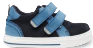
LAGAN OS-TN5 | TN8 | 21-35