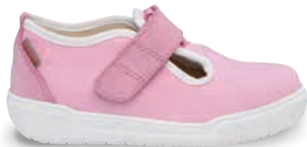
KLARA OS-TN5 | TN8 | 18-32