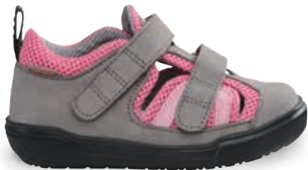
PAULA OS-TN5 | TN8 | 20-38