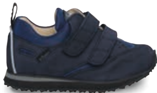
BLUE OS - TN5 | TN8 | 21-42