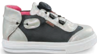
MINERVA OS-TN5 | TN8 | 24-32